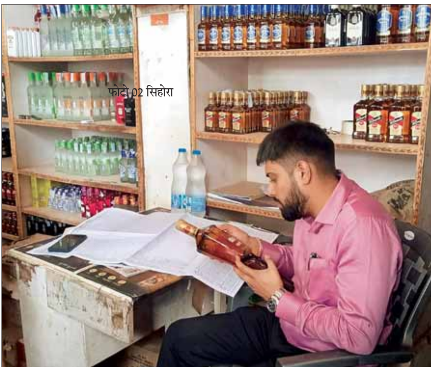
फोटो 02 सिहोरा

सिहोरा। मिलावट एवं मुनाफाखोरों पर अंकुश लगाने राजस्व एवं खाद्य विभाग के संयुक्त अमले ने सिहोरा में संचालित विभिन्न व्यावसायिक प्रतिष्ठानों की जांच कर नियम कानून कायदों की जानकारी देकर उसका शत प्रतिशत पालन करने की समझाइस दी। इसके साथ ही प्रतिष्ठानों में उपलब्ध खाद्य पदार्थों का स्टॉक, कीमत, एक्सपायरी डेट की जांच की। जब अधिकारियों की टीम जांच कर रही थी उसी समय नगर के अनेक छोटे-छोटे व्यावसायी अपना प्रतिष्ठान बंद कर फरार हो गये। जब तक जांच जारी थी तब तक अनेक स्थानों पर हड़कंप की स्थिति बनी रही।